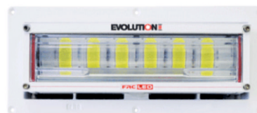
FCA100-V15 (zapuštěná montáž)

verze s madlem na tyč (madlo a tyč nejsou součástí dodávky)