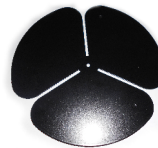
Držák majáku (hliníková střecha)

Výsuvná tyč pro majáky, obj.číslo: 2005011575